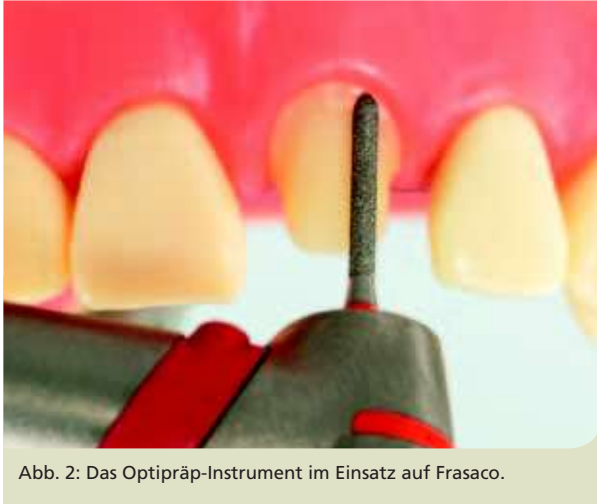
Abb. 2: Das Optipräp-Instrument im Einsatz auf Frasaco.

Teil bin von den Vorteilen und den Ergebnissen, die diese Instrumente liefern können, absolut begeistert.